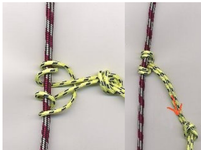
Figura. 1 Nudo prusik tomado de http://www.seccionmontanajo.com/node/78 .

Los bloqueadores dentados son más agresivos con la cuerda. Los bloqueadores de cordino son más fáciles de desbloquear y menos agresivos con la cuerda pero se deslizan más fácilmente sobre cuerdas muy delgadas, mojadas, con barro o heladas. (Ver link de video “resistencia del nudo prusik”). (1)